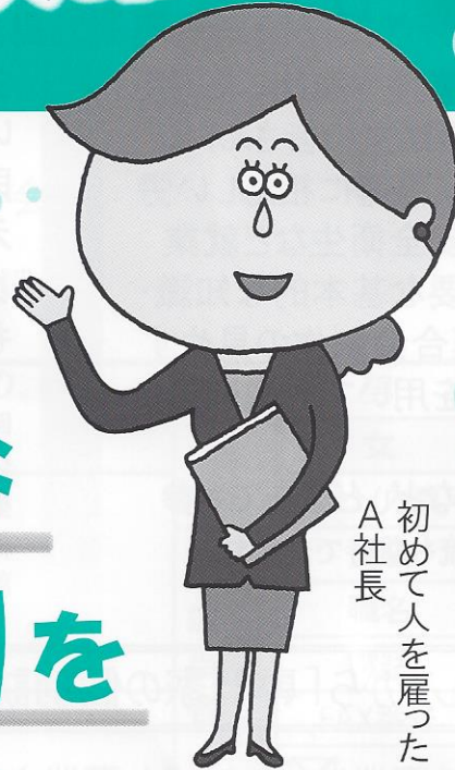
A社長 初めて人を雇った